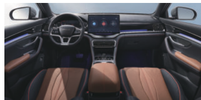
Schwarz und Braun